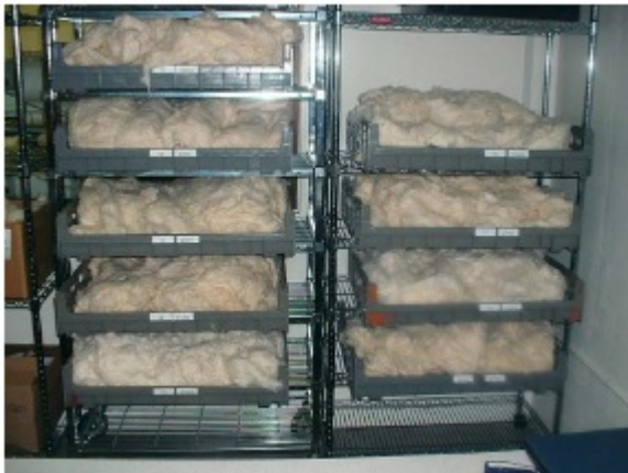
Хранение образцов для кондиционирования (компания Астер)